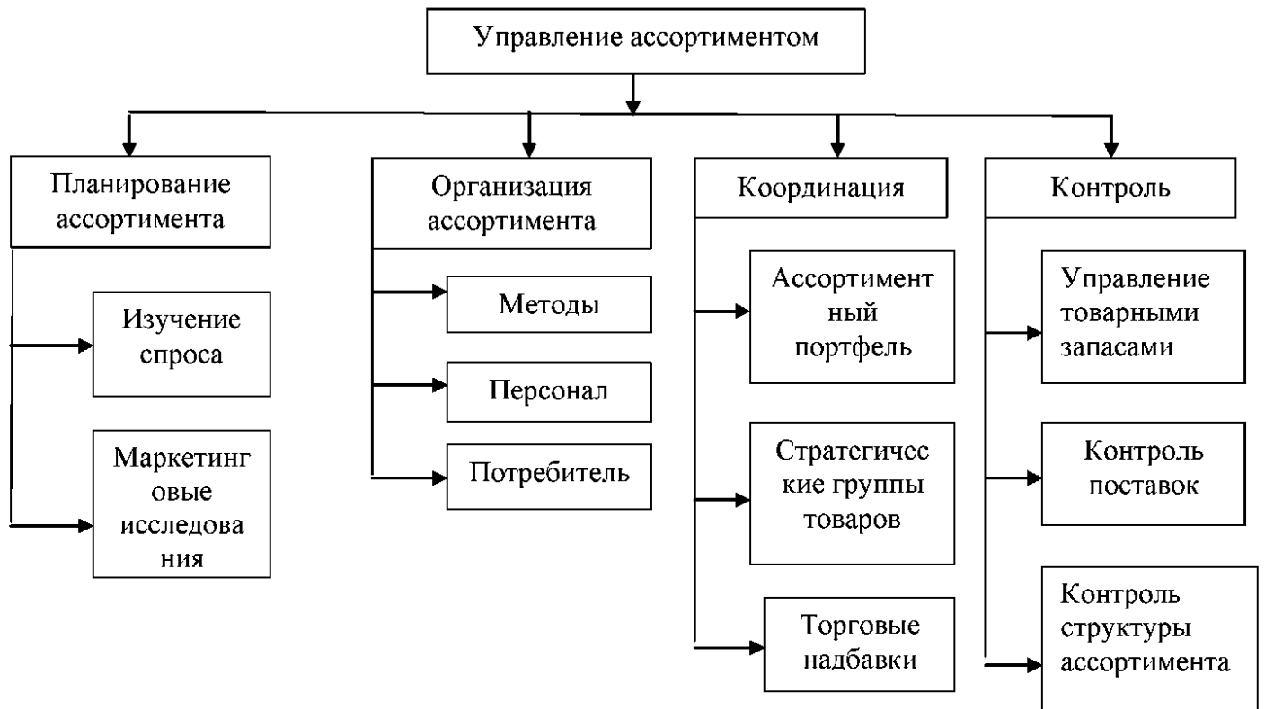
Рисунок 1. Структура функций ассортиментной политики организации